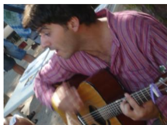
due immagini dalla galleria del concorso Smorfie da Esecuzione